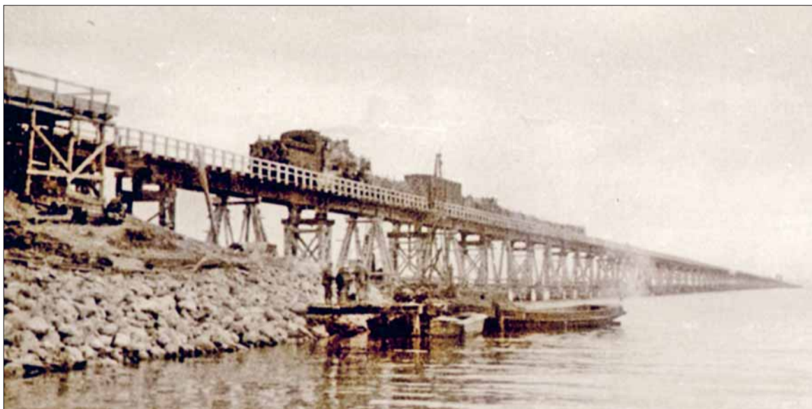
Таким был мост во время войны

Однако в 30-е годы, в период индустриализации страны, о проекте вспомнил великий вождь Иосиф Сталин. На этот раз одновременно с мостом хотели реконструировать и примыкающие к нему железные дороги. Магистраль должна была пройти с юга Украины, от Херсона через Крым, далее по мосту через Керченский пролив, по Таманскому полуострову с выходом в