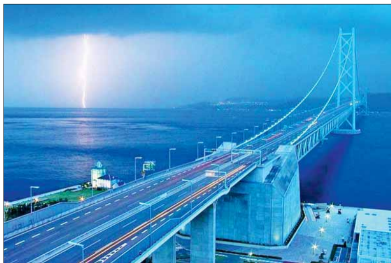
Таким мост будет к 2018 году

строительства моста опровергает слухи о его строительстве только силами заключенных, так как для ее осуществления требовались специализированные организации, оснащенные специфической техникой (передвижные электростанции и электросварочные агрегаты, копры, подъемные краны и мастерские на железнодорожном ходу и плавучие краны, экскаваторы и автомобили большой грузоподъемности, паровозы и морские суда, водолазные